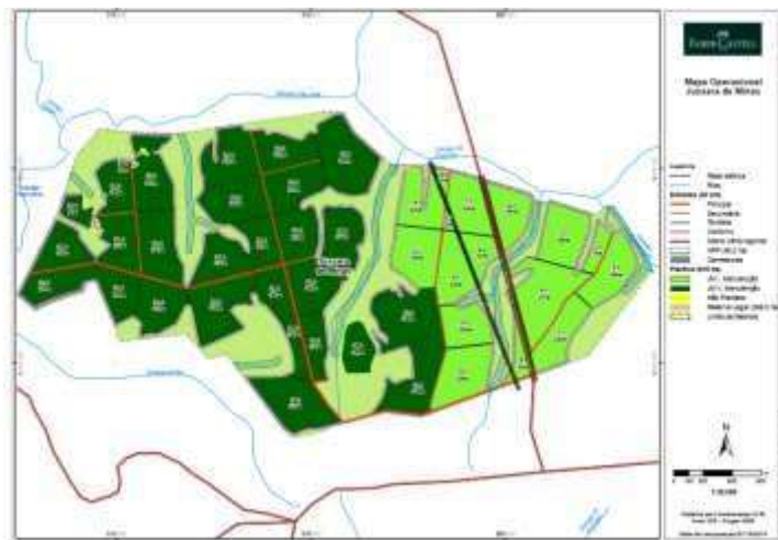
Figura 11. Mapa do Parque Jussara de Minas.

As medidas e práticas para manter os atributos da AAVC estão descritos no item “Plano para Proteção de Espécies da Fauna e da Flora”, deste documento.