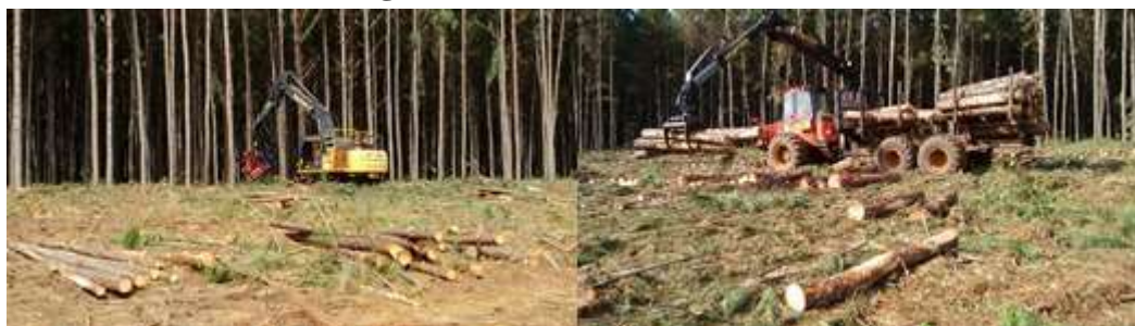
Figura 6. Harvester e forwarder.

Durante a colheita os galhos e acículas são deixados na área formando uma faixa de resíduos sobre a qual as máquinas podem transitar reduzindo assim seu impacto sobre o solo.