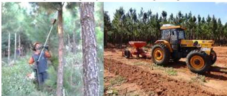
Figura 5. Operações de subsolagem e poda.