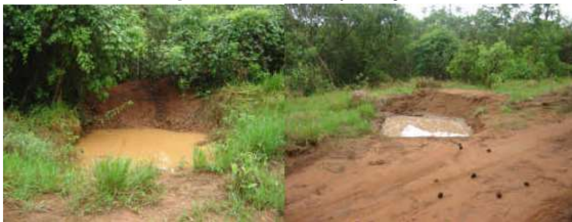
Figura 10. Caixas de retenção de água.

Nas áreas de plantio de Pinus onde existe maior declividade, as caixas de retenção também foram implantadas. As reformas e readequações das caixas são medidas de manutenção realizadas ao longo do ano e após o período chuvoso. Outra medida importante adotada nos Parques Florestais é a manutenção da serapilheira existente nas áreas de plantio.