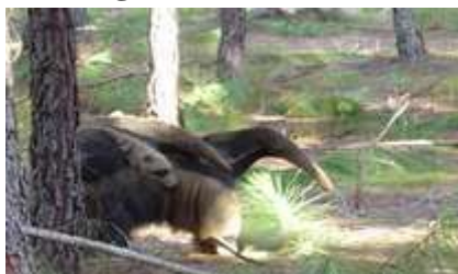
Figura 8. Tamanduá.