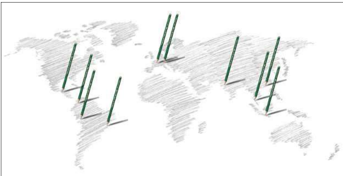
Figura 1. Fábricas e Escritórios da Faber-Castell no Mundo.

Mundialmente reconhecida pela qualidade em seus produtos, a Faber-Castell é a maior fabricante de EcoLápis de madeira plantada e está presente em mais de 100 países, contando com 14 fábricas, 20 escritórios comerciais e cerca de 7.000 colaboradores em todo o mundo. Produz mais de 1 mil itens diferentes, desde EcoLápis de cor e de grafite, EcoGiz de cera, massa de modelar, canetas, lapiseiras, marcadores, cds, disquetes, cartuchos compatíveis de impressão até exclusivas canetas-tinteiro.