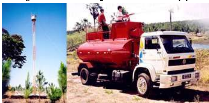
Figura 7. Torre de vigilância e caminhão pipa.

A conscientização e bom relacionamento com os que vivem nas divisas dos Parques Florestais são reconhecidamente muito importantes e necessários para que a Faber-Castell possa manter o seu Manejo Florestal e assegurar o atendimento de seus objetivos. Por isso realizam-se periodicamente a atualização de cadastro dos vizinhos e a divulgação do telefone, para atendimento a emergências nos parques florestais, 0800 34 9505.