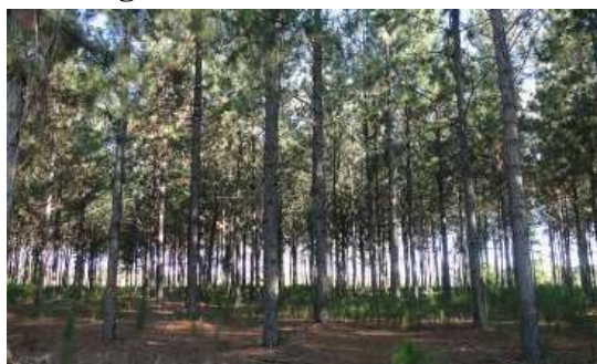
Figura 4. Pomar de Sementes.