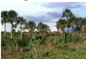
Figura 9. Vereda.