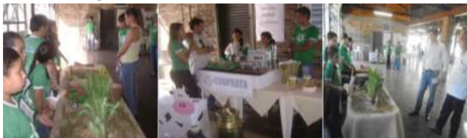
Figura 12. Fotos da Feira SócioAmbiental 2014.